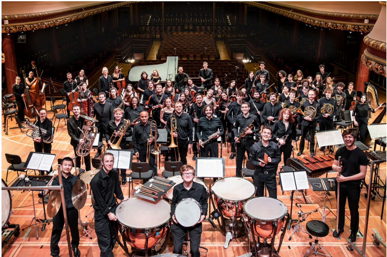
Mars 2025, Concert de l'Orchestre Juventutti – F. Volpe

Nous nous efforçons de défendre la richesse des œuvres symphoniques — allant de l'époque baroque à la création suisse contemporaine — en privilégiant une direction artistique indépendante, attrayante et divertissante pour le plus grand nombre, notamment auprès des jeunes. Au-delà de la démarche artistique de notre engagement, notre ensemble demande une organisation complexe pour aboutir à des concerts, comparable à une grande entreprise. Tout ce qui en découle ne peut qu'être enrichissant au profit des perspectives professionnelles de nos membres et de notre comité.