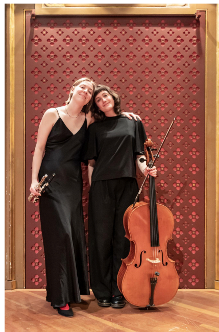
Mars 2025, concert de l'Orchestre Juventutti – F. Volpe