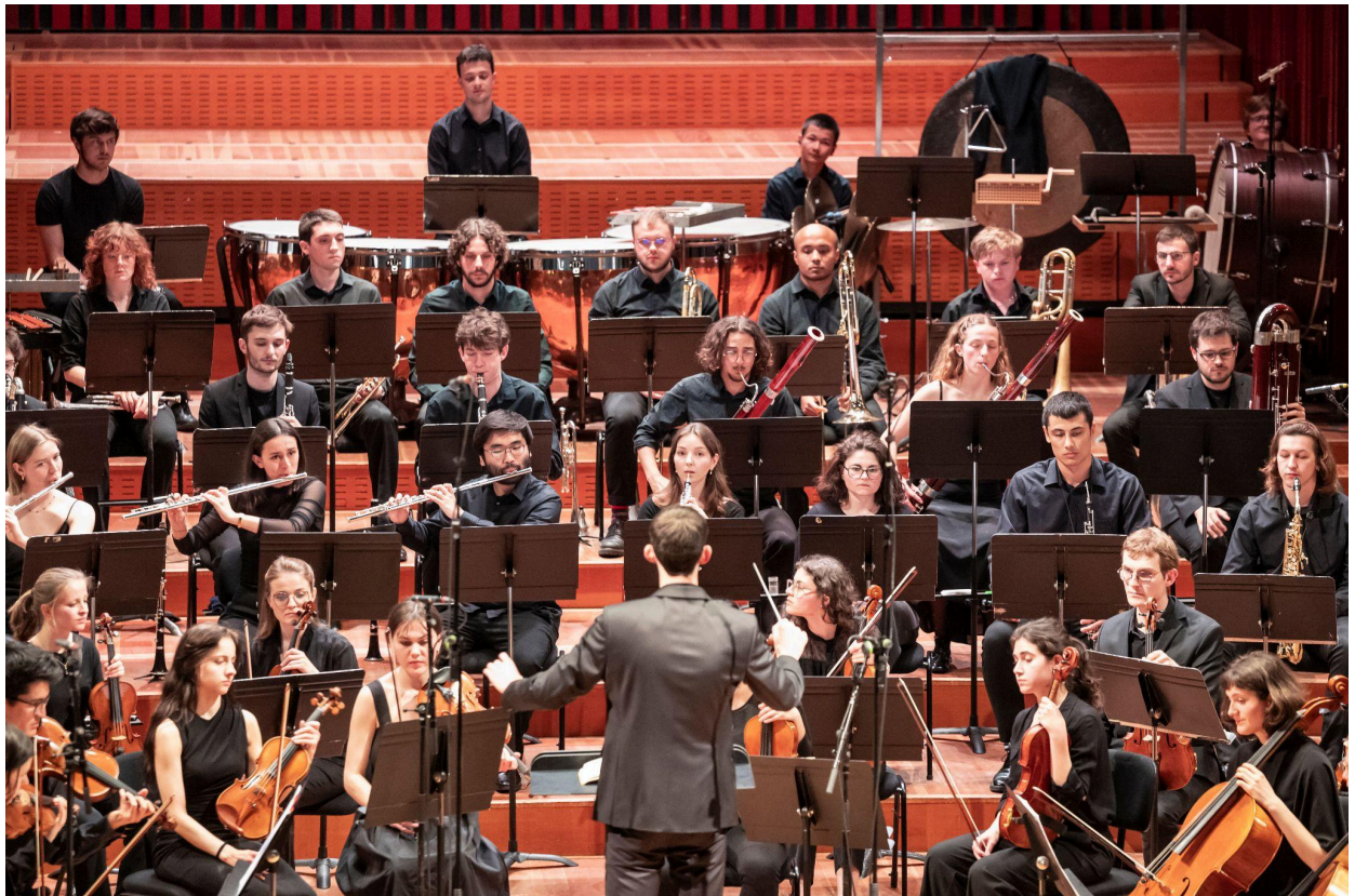
Mars 2025, concert – F. Volpe

Chaque année, la participation à la Fête de la Musique est convoitée par l'Orchestre Juventutti. L'orchestre peut alors se rassembler une dernière fois avant la pause estivale. Nous avons pu nous produire à nouveau dans la salle magnifique du Victoria Hall, le vendredi 20 juin et joué une nouvelle fois le Triple Concerto de Beethoven avec le Trio Ernest. L'Ensemble baroque a également pu donner un concert devant une salle comble, à la cathédrale Saint-Pierre le samedi 21 juin.