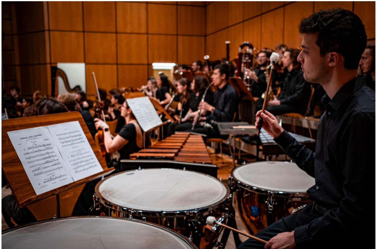
Mars 2025, concert à la salle Frank Martin – B. Wisard

Ce rapport, qui illustre les activités effectuées par le département de la logistique cette année, pourra également servir de base de transmission aux futurs responsables, afin de pérenniser les acquis et d'améliorer encore l'efficacité de la logistique de l'orchestre.