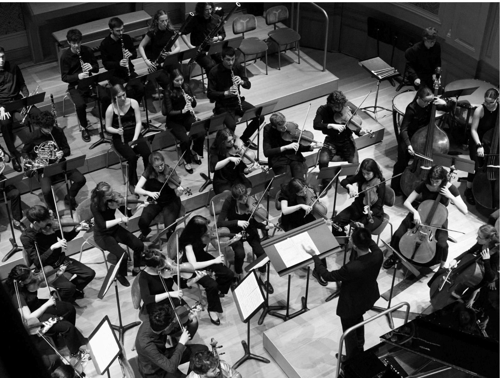
Mars 2025, concert de l'Orchestre Juventutti – B. Wisard