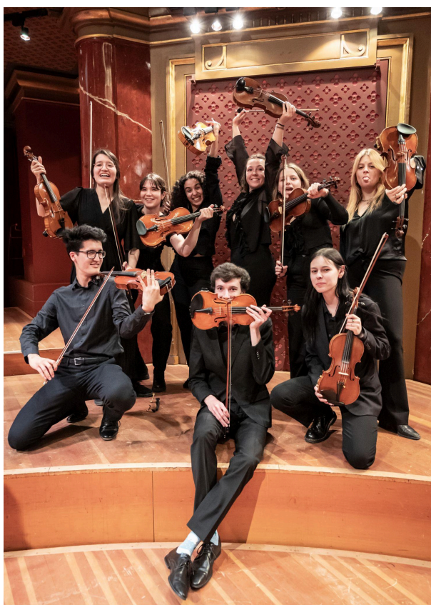
Mars 2025, concert de l'Orchestre Juventutti – F. Volpé

La mission principale de cette année pour le département des ressources humaines fut de constituer un effectif complet pour la grande session symphonique, qui comprenait un grand nombre de répétitions, et donc une grande disponibilité de la part des musicien.ne.x.s. De plus, le programme contenait certains instruments inhabituels, comme du saxophone ou de l'euphonium et un nombre important de percussions. L'effectif était composé d'une manière similaire à celui des années précédentes, avec un équilibre entre des étudiant.e.s en haute école de musique, notamment parmi les vents, de jeunes musicien.ne.s en filière pré-professionnelle, des élèves en formation dans les diverses écoles de musique genevoises et des amateur.ice.s. Les âges étaient variés, notamment avec quelques recrues plutôt jeunes, qui permettent d'envisager peu à peu un renouvellement de l'effectif, afin que les ancien.ne.s qui quittent l'orchestre laissent leur place à de plus jeunes au fur et à mesure. La gestion de l'effectif a éprouvé une seconde étape en amont du concert à la Fête de la musique de Genève, car certain.e.s musicien.ne.s n'étaient plus disponibles pour ce concert. L'été a