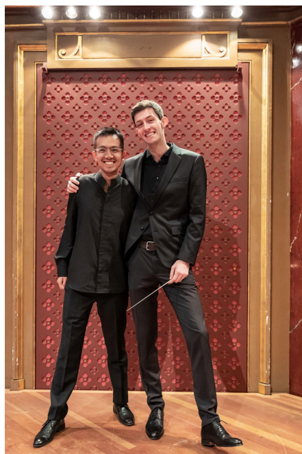
Mars 2024, Victoria Hall – F. Volpé

Le programme a su séduire le public, dont nous avons eu pléthore de retours positifs et valorisants. L'opportunité de jouer deux fois au Victoria Hall a représenté un cadre de haute qualité pour les musicien.ne.s et le pour le public.